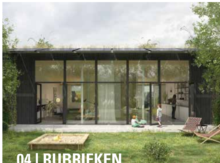
Foto André Verschoor (p. 6) Vincent Basler • www.vincentbasler.com .

Cover en p. 3 (Domoticube) Heren 5 Architecten • www.heren5.eu .