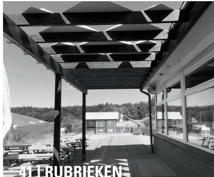
Foto p. 7 (Michiel Visscher) Laura Nieuwenhuis • www.lauranieuwenhuis.nl.

Foto cover Rindert van den Toren • www.rindert.nu.